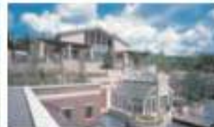
エキシブ蓼科 長野県茅野市蓼科高原山荘 4035