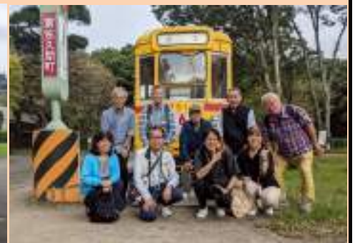
とても楽しい講習でした

今時は、写真はスマホで撮るのが当たり前。参加者はコンパクトカメラ5名、スマホが4名。わかりやすい説明と丁寧なテキストで、基本がスムーズに学べました。