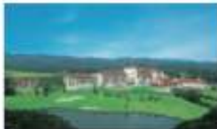
グランドエキシブ那須白河 栃木県那須白河町那須中央公園内