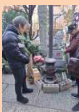
弁天堂 懐しのストーブ