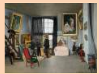
フレデリック・バジール