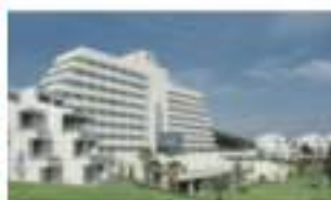
グランドエキシブ鳥羽 三重県鳥羽市世帯町字二ツ又 212-1