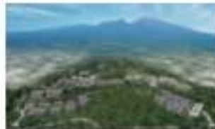
エキシブ軽井沢&パセオ 長野県北佐久郡軽井沢町大字湯沢分譲地15区画内