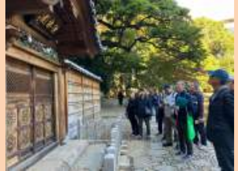
松下会長がボランティアガイド