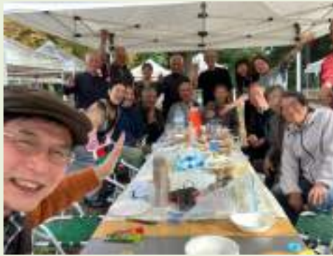
バーベキューは本当にみんなが楽しめるイベントです