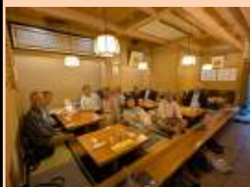
いつものよし寿司で