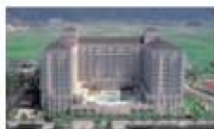
エキシブ琵琶湖 滋賀県大津市磯部 1471-2