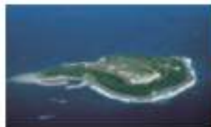
グランドエキシブ初島クラブ 静岡県熱海市初島 800