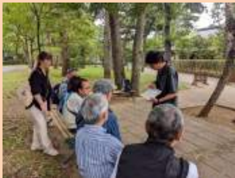
紙芝居を使って解説

開催日時：2025年10月9日(木) 実施場所：江戸東京たてもの園 参加人数：10名(講師含む) (講師は青朋会会員です)