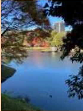
絶景の小石川後樂園