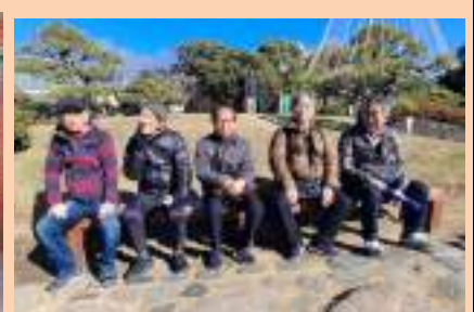
清澄庭園でのんびり