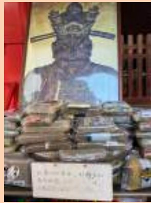
源覚寺のこんにやく閻魔