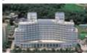
エキシブ淡路島 兵庫県淡路市小島町平谷 1275-1