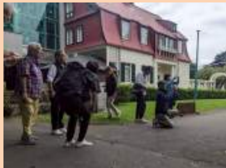
参加者が撮影実技を開始