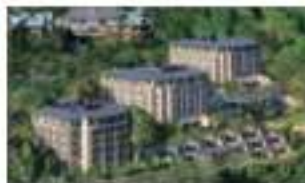
エキシブ箱根離宮 神奈川県足柄下郡箱根町宮ノ下 112-2