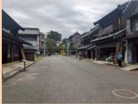
ロケ地となったのは江戸東京たてもの園