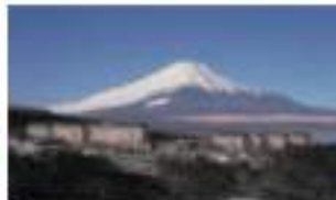
エキシブ山中湖 山梨県那須高原山中湖村平野 362-33