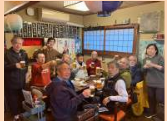
お疲れ生は「あたりめ」

新年の福を求め、久々に20名を超える参加がありました。 昨年より復活した午前開催のランチ付コースで堪能。