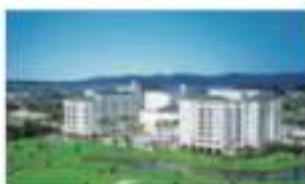
グランドエキシブ浜名湖 静岡県浜松市西区村瀬町字池ノ原 4420