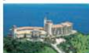
エキシブ輪門 徳島県鳴門市大塚町新町上三津 157-1