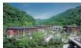
エキシブ京都八潮離宮 京都府京田辺市八潮町長町 74-1