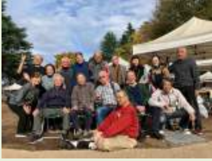
アイコンになっている集合写真