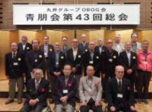
米寿・喜寿の皆様