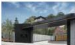
エキシブ湯河原離宮 神奈川県相模原市湯河原町上631-1