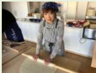
野島先生の指導を受けました