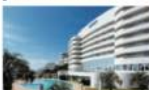
エキシブ白浜&アネックス 和歌山県白浜町大字野田町山 1215-76/1575-44