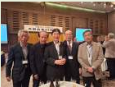
朝妻前々会長を囲んで