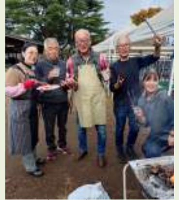
焼くのがとても楽しい

心配された天気も持ち直して、絶好の紅葉日和となり、美味しい料理を食べながら、昔話や近況など楽しく語り合いました。