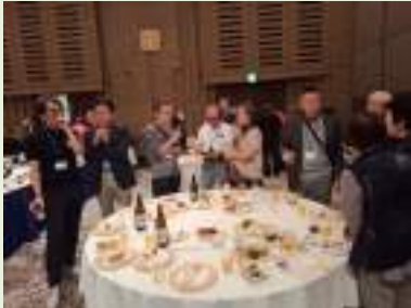
色々な世代の交流が