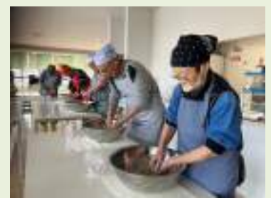
もう常連になりました