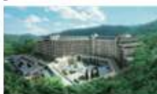
エキシブ有馬離宮 神奈川県三浦市有馬町 1951-11