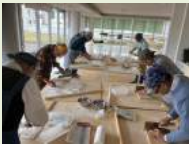
各自の手つきも皆手慣れたもの